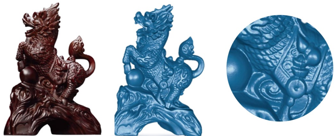
• Données du EinScan H2